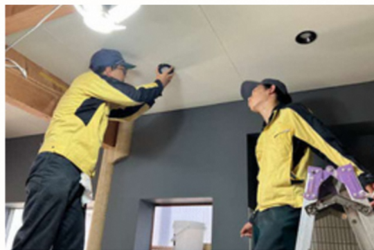
電ボラ 地域交流活動[古民家再生]