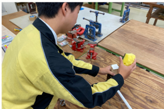
窓掃除用器具の製作