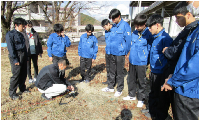
接地抵抗、絶縁抵抗の測定