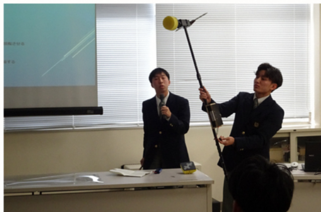
自動窓掃除機の製作

3年生の皆さんには、この課題研究での経験を活かして社会で活躍して欲しいと思います。