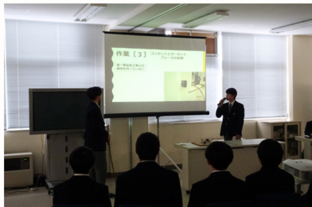
電気工事を実践する