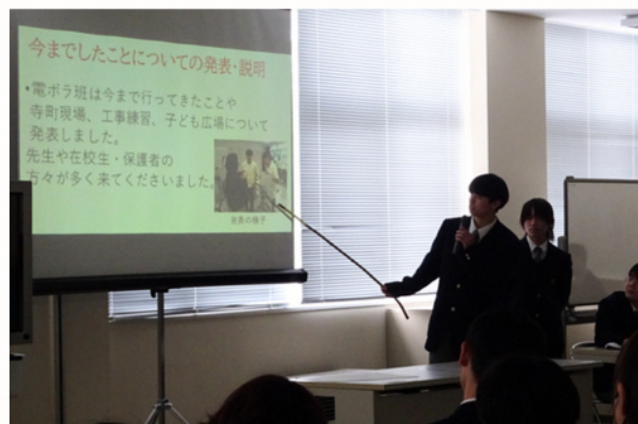
電気で地域を元気にしたい！ ボランティアねっと（電ボラ） ～工事技能をいかした課題解決型学習～